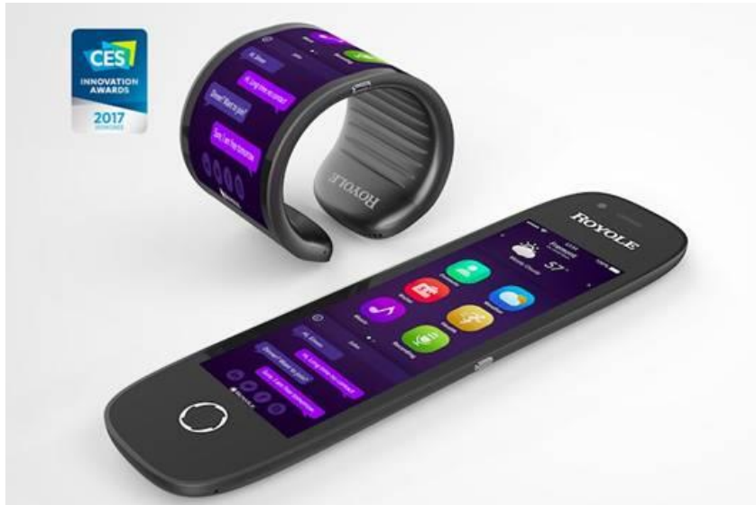
可卷曲穿戴手机原型 FlexPhone™