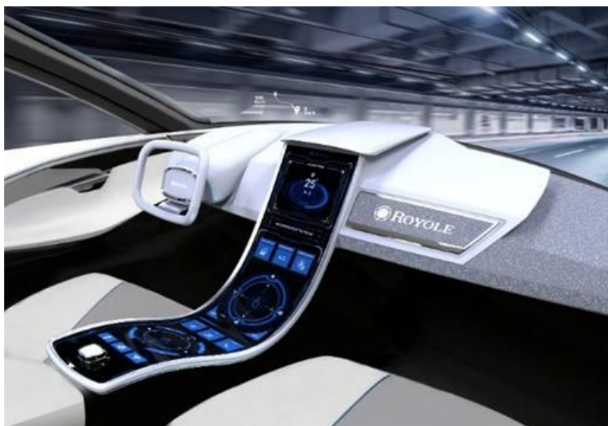
柔性电子弧形汽车中控