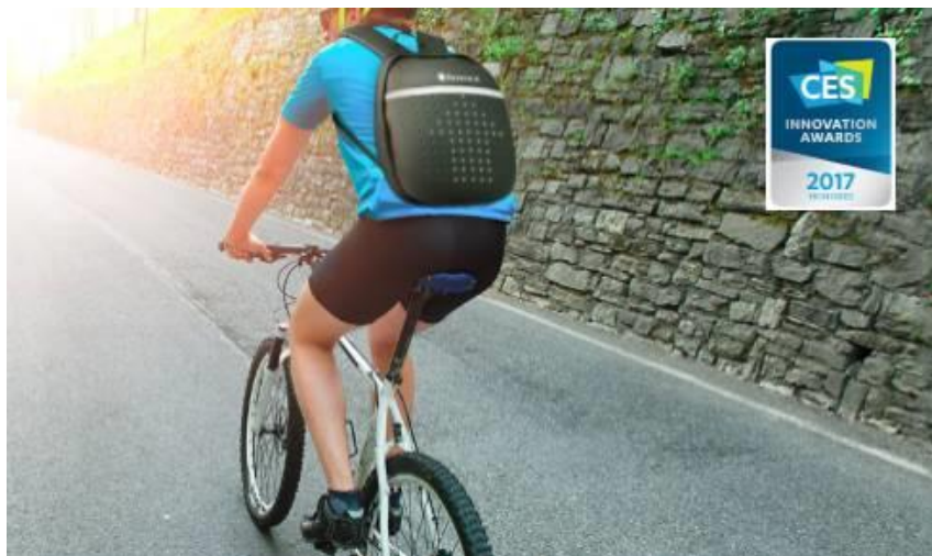
柔性电子智能背包